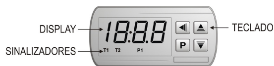
Figura 2 – Painel frontal do controlador

No painel frontal do controlador o sinalizador P1 acende quando a saída de controle é ligada.