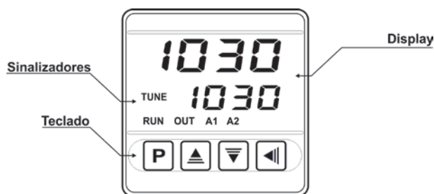
Fig. 02 - Identificação do painel frontal

O painel frontal do controlador, com seus elementos, pode ser visto na Fig. 02: